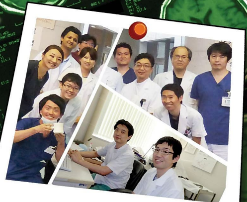
なんでも 相談にのります！