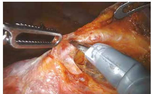
図4 下腸間膜動脈周囲郭清 4th armで下腸間膜動脈を挙上し、1st armで動脈周囲のリンパ節を把持、 3rd armのモノポーラーシザーズで剥離を行う。

は本邦では緩徐であった。当院では、看護師、臨床工学士、麻酔科とともに院内におけるシミュレーションを行い、販売会社主導のトレーニングパスに従い認証登録を取得し、自由診療における病院負担で、早い段階での安全な導入が可能であった。