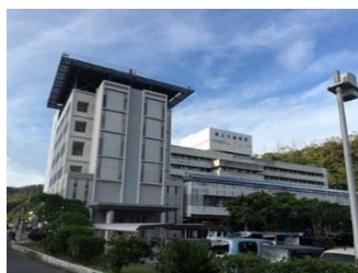
建物左は新設された救命救急センター