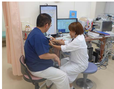
過去の実習の様子