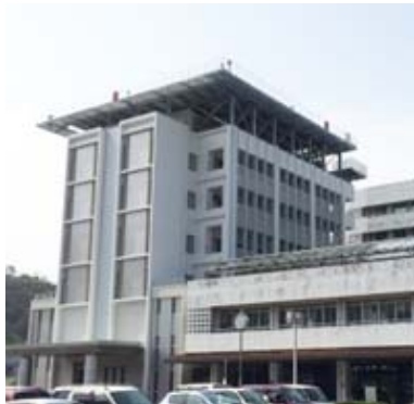
救命救急センター外観