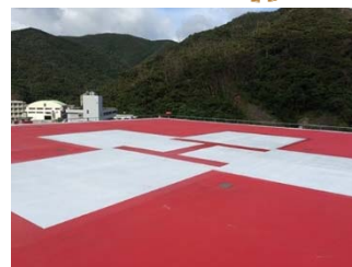
救命救急センター屋上のヘリポート