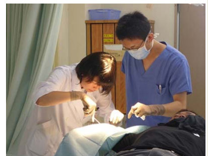
過去の実習の様子