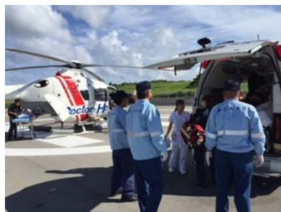
ドクターヘリ (実習中に遭遇)