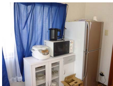
調理器具(食器も完備)