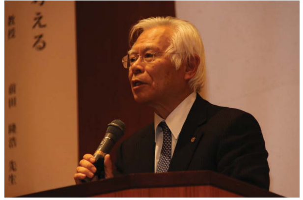
鹿児島大学学長挨拶