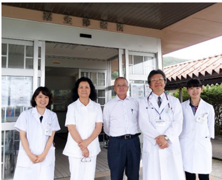
実習先の先生方と